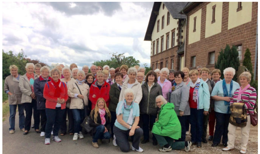
Pilger der Trier-Buswallfahrt in Dodenburg vor dem Pilgerkreuz