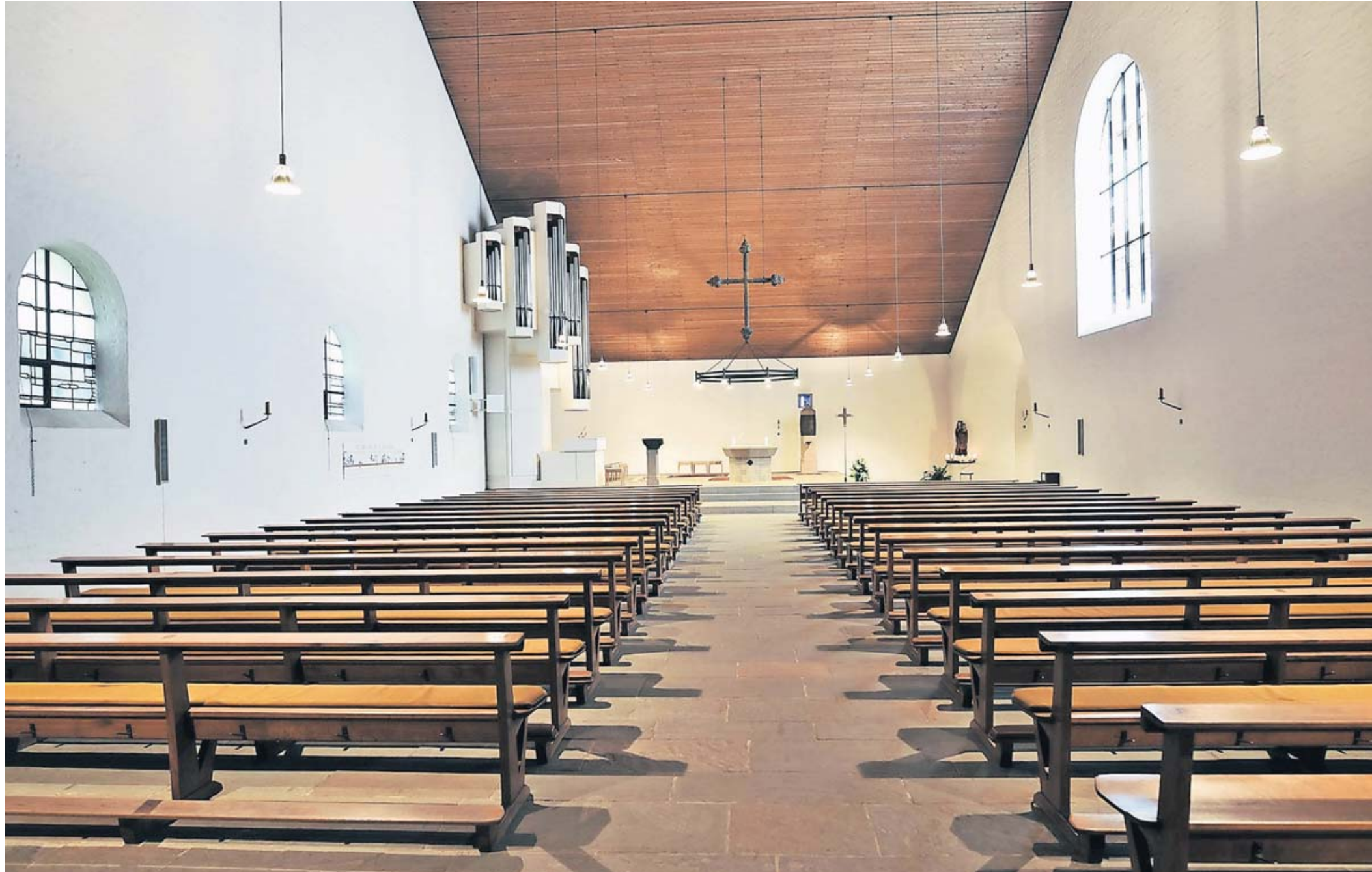
An der niedrigsten Stelle des Langhauses betreten Besucher die Kirche. Die 1978 von Heinz Wilbrand gebaute Orgel mit 16 klingenden Registern und mechanischer Traktur wurde nach dem Umbau des Altarraums nach Entwürfen des Krefelders Karl Otto Lüfkens an der Nordwand der Kirche zwischen zwei Rundbogenfenstern platziert. Die Fenster in der Nordwand schuf Hubert Spierling (Krefeld) in zurückhaltenden Grau- und Silbertönen.

1959 wurde die St.-Bonifatius-Kirche, ein nach Osten ausgerichteter Saalbau mit großem Satteldach und einem in Querrichtung liegenden First, geweiht. Architekt Emil Steffann hatte eine „Notscheune“ in Lothringen als Vorbild genommen. Der zurückhaltende Bau in Krefeld-Stahldorf soll vielen Menschen einen Raum bieten.