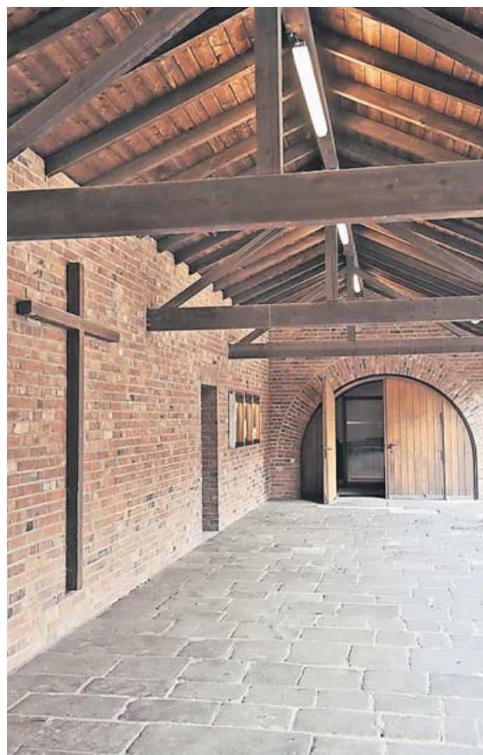
Am Ende der offenen Halle, die den Innenhof westlich einfasst, führt die Rundbogentür ins Kircheninnere.