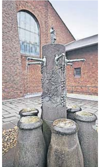
Den Hochzeit-zu-Kana-Brunnen im Innenhof krönt eine Marienstatue.