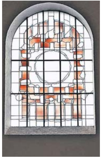
Das große Bogenfenster, 1990 vom Krefelder Künstler Hubert Spierling entworfen, versinnbildlicht das „Himmlische Jerusalem“.