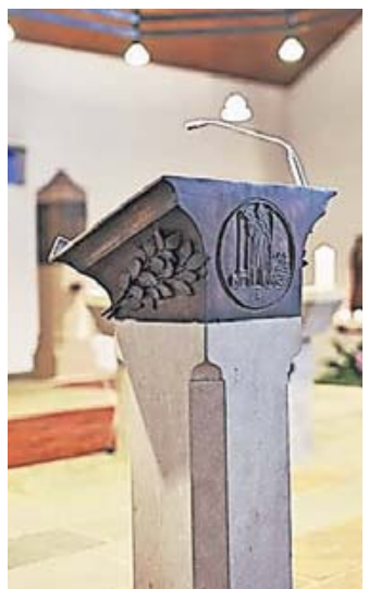
Die Bronze des Ambo (Theo Heiermann, 1990) zeigt den Heiligen Bonifatius.

Schlicht und zugleich anmutig, fügt sich die Scheunenkirche selbstbewusst in die Umgebung ein. Ihre außergewöhnliche architektonische Struktur ist für die Gemeinde in Stahldorf ein Schatz.