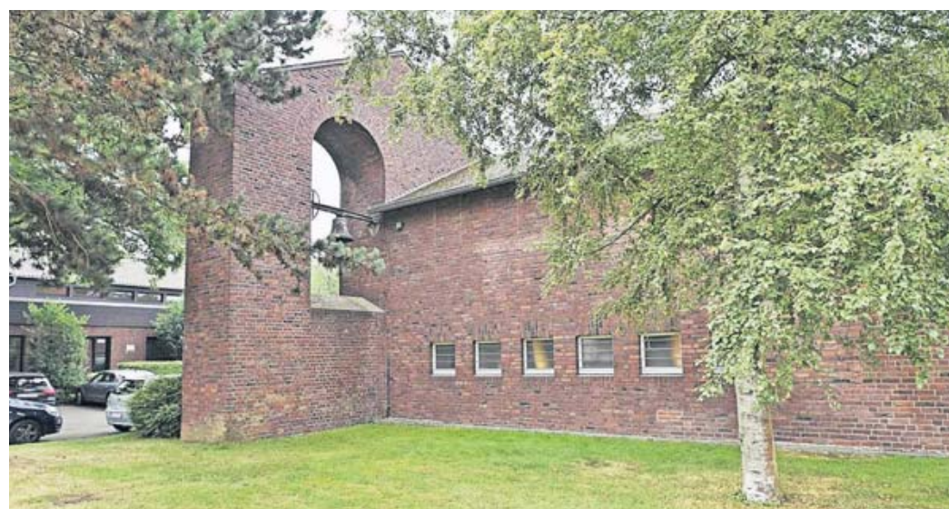
Der Ostflügel mit dem erweiterten Glockenturm, der die umliegenden Gebäude kaum überragt. Zur Bauzeit der Kirche beherrschte ein Wasserturm den Krefelder Süden, gegen den Kirchenbaumeister Steffann „nicht anbauen“ wollte.