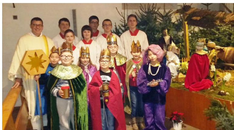
Sternsinger in St. Bonifatius am letzten Sonntag

Herr, gib ihnen und allen Verstorbenen die ewige Ruhe und das ewige Licht leuchte ihnen. Lass sie ruhen in deinem Frieden. Amen